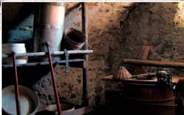
Utensilien aus der Zeit um 1880. In diesem Jahr schrieb Johanna Spyri «Heidi»