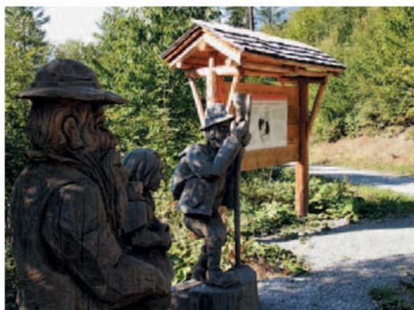
Heidi-Erlebnisweg vom Heidadorf zur Heidalp: 12 Stationen erzählen die beliebteste Geschichte von Heidi und Peter

Heidi begeistert seit Jahrzehnten Kinder in aller Welt und lässt auch Erwachsenenherzen höher schlagen. Trotz internationalen Auftritten in Büchern, Musicals, Zeichentrickserien und Filmen hat unser Heidi seine Wurzeln aber nicht vergessen. Denn nirgends auf der Welt ist Heidis Aura und Persönlichkeit spürbarer als im authentischen Heidadorf mit dem Original Heidahaus oberhalb von Maienfeld. Hierher gelangt man vom Städtchen Maienfeld über den erlebnisreichen Heidiweg oder – wer's bequemer mag – mit dem Auto. Wer höher hinaus will kann auch den Alpöhi hoch über Maienfeld besuchen.