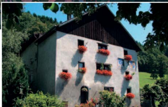
Im Heidadorf scheint die Zeit stehen geblieben zu sein

Heidi begeistert seit Jahrzehnten Kinder in aller Welt und lässt auch Erwachsenenherzen höher schlagen. Trotz internationalen Auftritten in Büchern, Musicals, Zeichentrickserien und Filmen hat unser Heidi seine Wurzeln aber nicht vergessen. Denn nirgends auf der Welt ist Heidis Aura und Persönlichkeit spürbarer als im authentischen Heidadorf mit dem Original Heidahaus oberhalb von Maienfeld. Hierher gelangt man vom Städtchen Maienfeld über den erlebnisreichen Heidiweg oder – wer's bequemer mag – mit dem Auto. Wer höher hinaus will kann auch den Alpöhi hoch über Maienfeld besuchen.