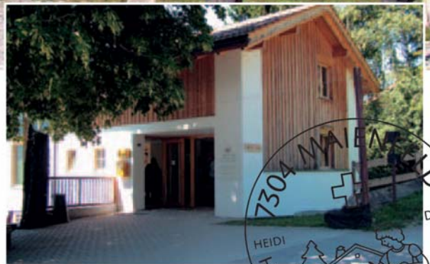
Heidipost und Dorfladen, wo Fans und Sammler alles finden