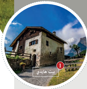
1 بيت هايدي