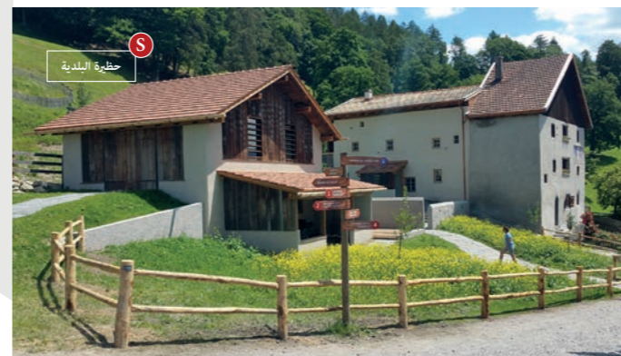
6 حظيرة البلدية