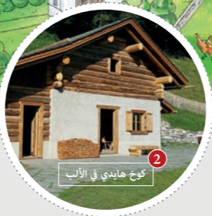
2 كوخ هايدي في الألب