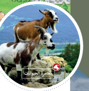
5 مغامرة الحيوانات