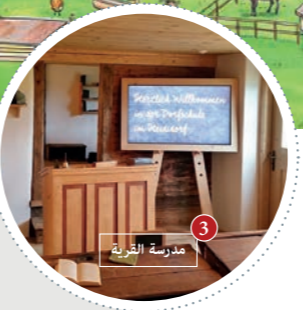
3 مدرسة القرية