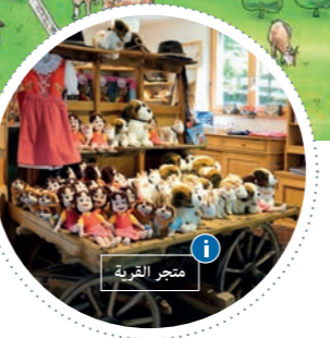
4 متجر القرية